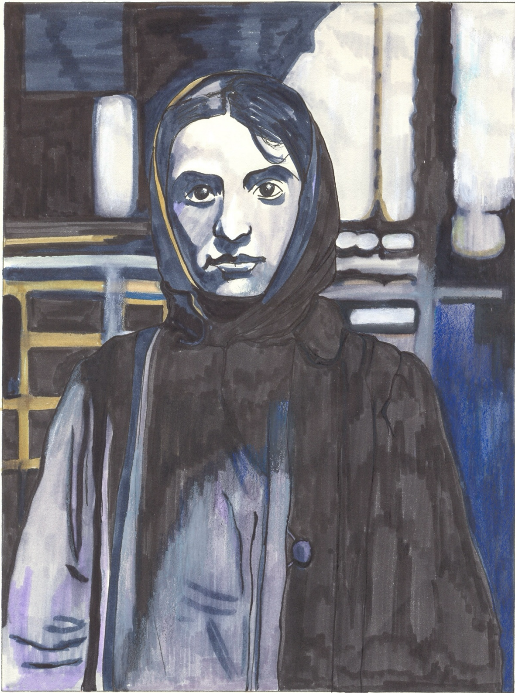
« Réfugiée »/ Zidani/ dessin feutres et bic/ 2004