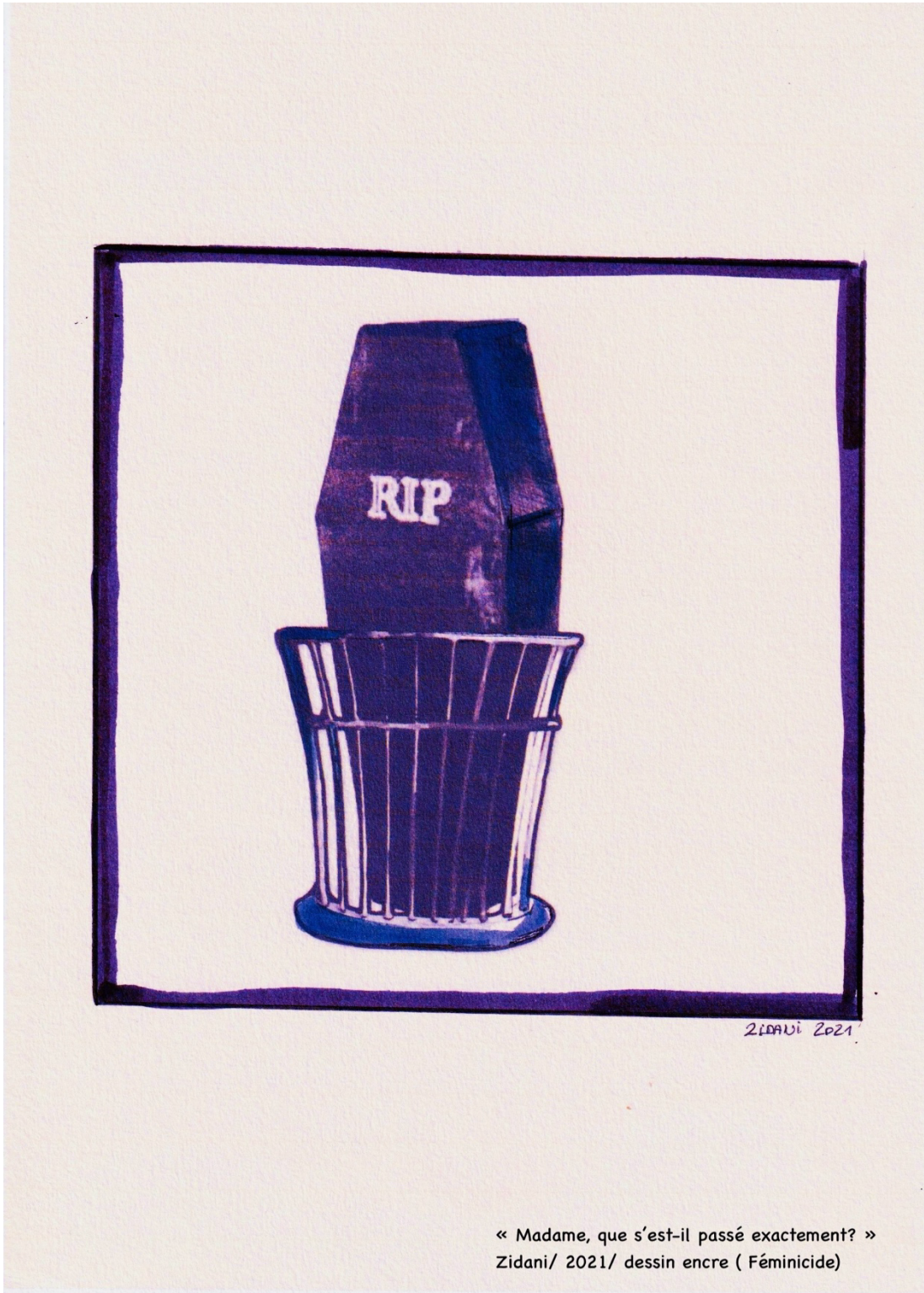
« Madame, que s'est-il passé exactement? » Zidani/ 2021/ dessin encre ( Féminicide)