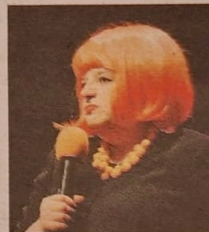
Zidani dans "I Will Survive"